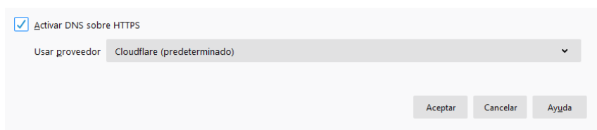
Figura 5. Proveedor DoH predeterminado en Firefox

Aunque Firefox permite configurar el servidor DoH libremente, al activar esta opción se establece por defecto (Figura 5) el servidor predeterminado de Cloudflare, el cual almacena las consultas realizadas durante 24 horas, como informa en su web.